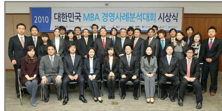
<2010 MBA Competition 운영 홈페이지>