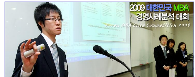
<2009 MBA Competition 운영 홈페이지>